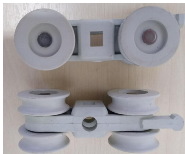
ROLDANA - VISTA LATERAL E SUPERIOR